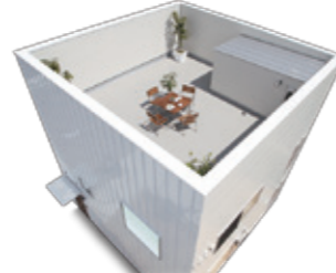
本体価格 300 万円(税抜)