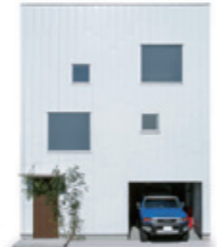
本体価格 500 万円(税抜)