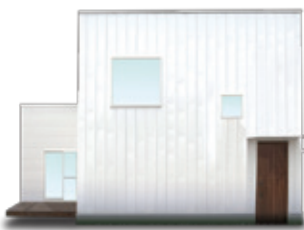
本体価格 200 万円(税抜)