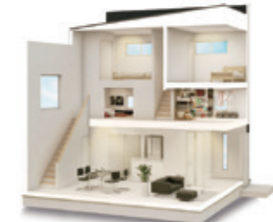
本体価格 200 万円(税抜)