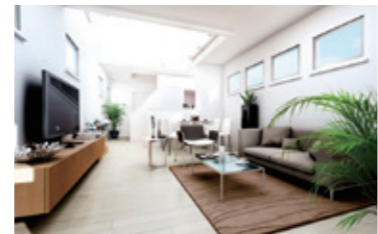
本体価格 1,000 万円(税抜)

大人気規格住宅 ZERO-CUBE の高いデザイン性と自分たちらしい暮らし方に合わせてオプションを選んで足し算していく楽しさをそのままに狭小地向けのコンパクトサイズが仲間入り。その名も「ZERO-CUBE MINI」!